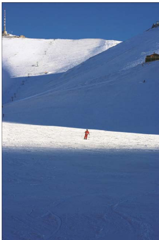
Fotografie : il portale della Cifte Minareli Medrese / le piste di Palandoken